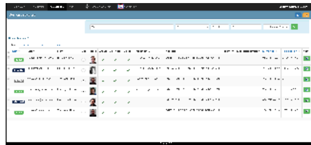
Vue gestionnaire des (demandes de) cartes