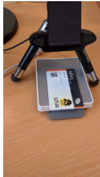
Lecteur NFC et Webcam pour encodage de carte en s'aidant du QR Code EPPN ou ESCR