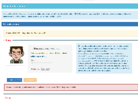
Interface web de demande de carte