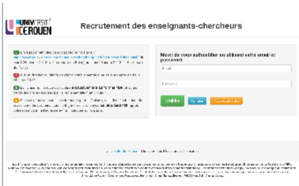
Page d'accueil - authentification (univ-rouen)