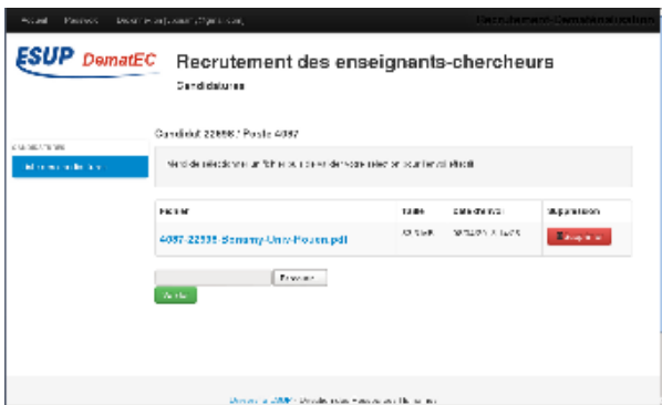
Page d'envoi de fichiers pour une candidature donnée (vue candidat)