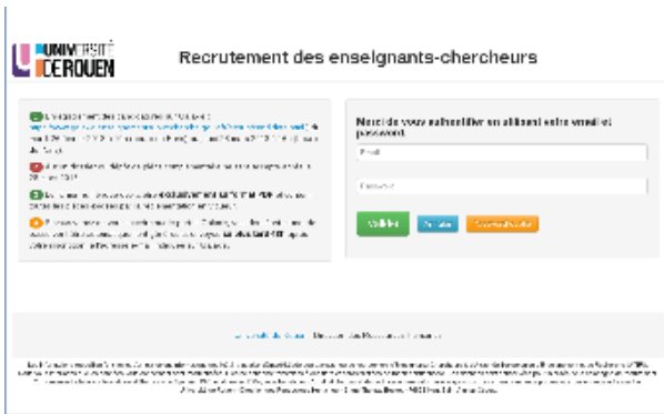
Page d'accueil - authentification (univ-rouen)