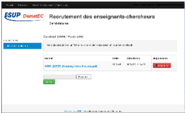
Page d'envoi de fichiers pour une candidature donnée (vue candidat)