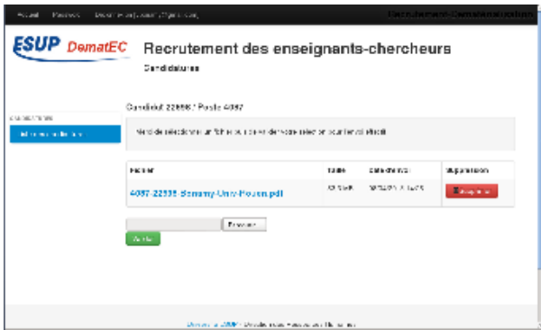
Page d'envoi de fichiers pour une candidature donnée (vue candidat)