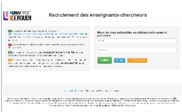
Page d'accueil - authentification (univ-rouen)