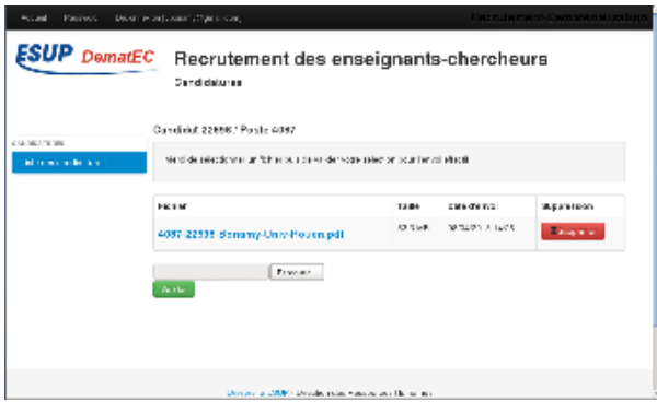
Page d'envoi de fichiers pour une candidature donnée (vue candidat)