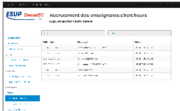
Page de logs après importation Galaxie (admin, super-manager, manager)